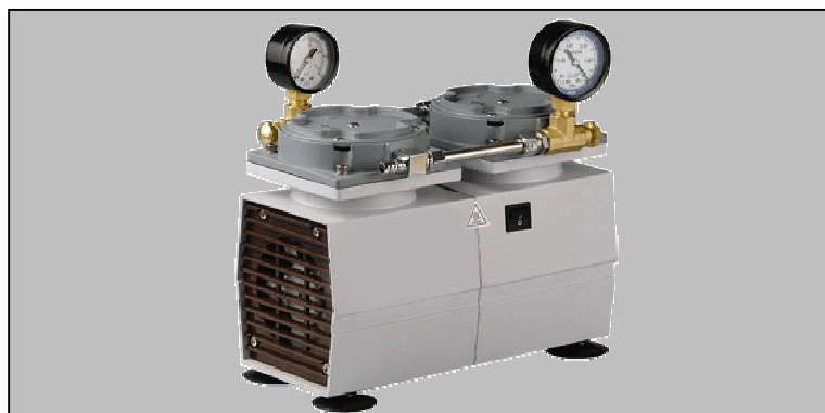
Pumpdown time for 20 ltr vessel