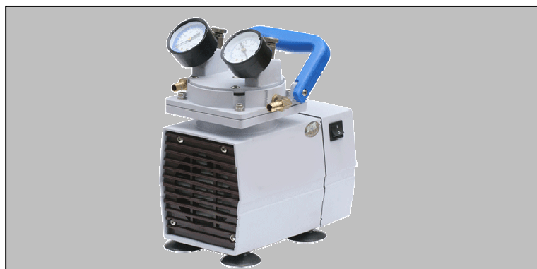
Pumpdown time for 10 ltr vessel