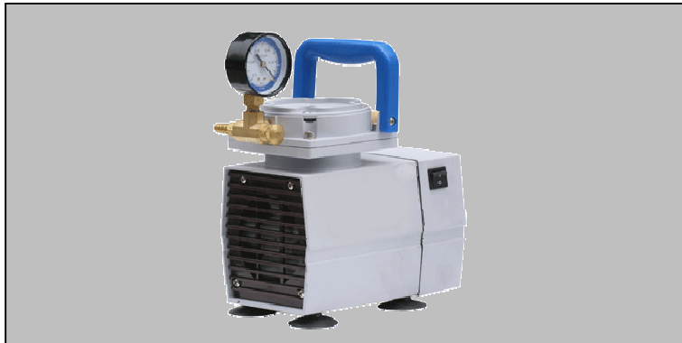
Pumpdown time for 10 ltr vessel