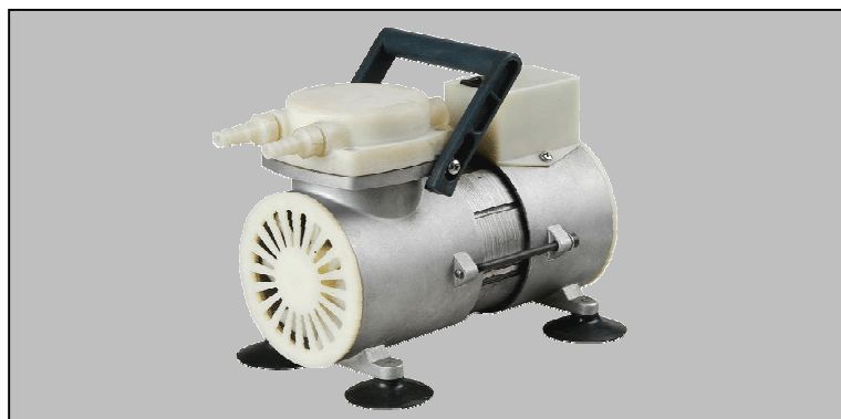
Pumpdown time for 5 ltr vessel