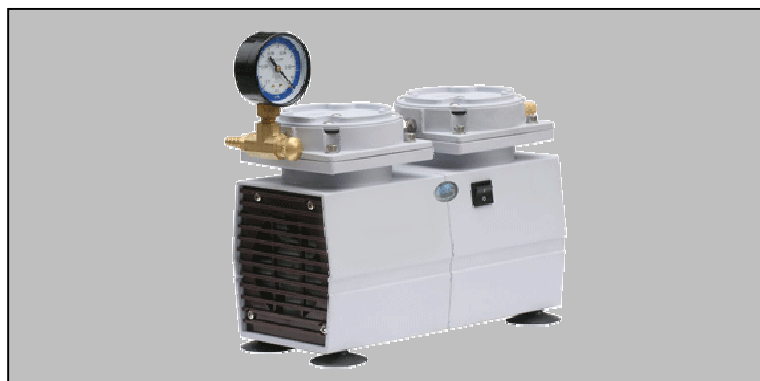
Pumpdown time for 10 ltr vessel