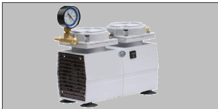
Pumpdown time for 20 ltr vessel